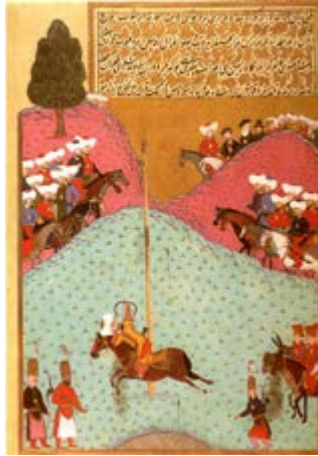
Sultan II. Murad, Okçuluk Tatbikatında 28

Türk tarihine bakıldığında spor etkinliklerinin büyük kısmının öncelikli olarak askerî eğitim amacına ve zor hayat şartlarına karşı mücadele vermeye yönelik gerçekleştirildiği görülür. Daha sonraki dönemlerin kaynaklarına bakıldığında bu faaliyetlerin güç sınaması, kabiliyet ve hüner gösterme, düğünlerde, toylarda, ziyafetlerde ve yaşlarda yapılan yarışmalar, gösteriler şeklindeki etkinlikler olarak geliştiği söylenebilir. Ayrıca bu faaliyetlerin gerçekleştirildiği alanların, genç kişinin kendini ispat etmesi, cesaret ve kahramanlık göstermesi için gerekli ortamın oluşturulması rolünü de yerine getirdiği görülür. Yine Türklerin hayat felsefesinin bir parçası olan alplik geleneğinin ilk ortaya çıktığı alanlar da buralar olmuştur. Türk edebiyatının başta destanları olmak üzere sözlü ve daha sonra yazıya geçirilen halk edebiyatı ürünlerinde de spor, oyun, yarışma ve eğlence etkinliklerinin çok teferruatlı bir şekilde anlatıldığı görülmektedir.