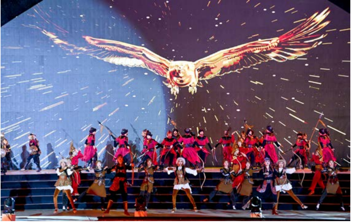
IV. Dünya Göçebe Oyunları Açılış Töreni 54

Kırgızistan tarafından başlatılan Dünya Göçebe Oyunları, Türkiye’de yapılan IV. Dünya Göçebe Oyunları ile çok daha ileri bir merhaleye taşınmıştır. Etnosporlar ve oyunların merkezde olduğu program başta Türk dünyası olmak üzere dünyanın çok farklı yerlerinden gelen insanların kültürlerinin buluşma alanı haline gelmiştir. Programda kültür sanat etkinlikleri, sahne gösterileri, gastronomi sunumları ve onlarca değişik aktivite gerçekleştirilmiştir. Programla ilgili rakamlara bakıldığında bu durum daha iyi anlaşılacaktır. 4 günde 1 milyonun üzerinde ziyaretçinin geldiği alan kültürel değerlere, geleneksel sporlara ve oyunlara olan ilgiyi bir kez daha ortaya koymuştur. Bununla birlikte bu durum, geleneksel spor ve oyun organizasyonunun geleceğiyle ilgili de ciddi bir ipucu vermektedir.