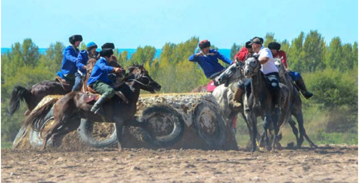
1. Dünya Göçmen Oyunları Kök Börü Müsabakaları, Bosteri, Kırgızistan 2014. 41