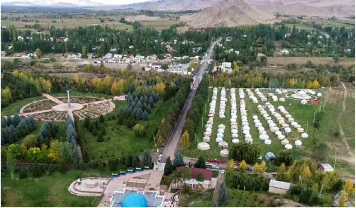
Talas Şehrinde Manas Kompleksi'nin içindeki I. Kırgız Göçmen Oyunları Alanının Bir Kısmı 53

Allah'ın izniyle Ulusal Göçebe Oyunları, milli birliğimizi pekiştiren, bir millet ve bir yurt oluşumuzun kutlaması olacaktır. Dünya toplumlarının ilgi duyduğu oyunlara dönüşecek. Eşsiz kültürümüzü dünyaya yayıp herkese göstereceğiz." 52