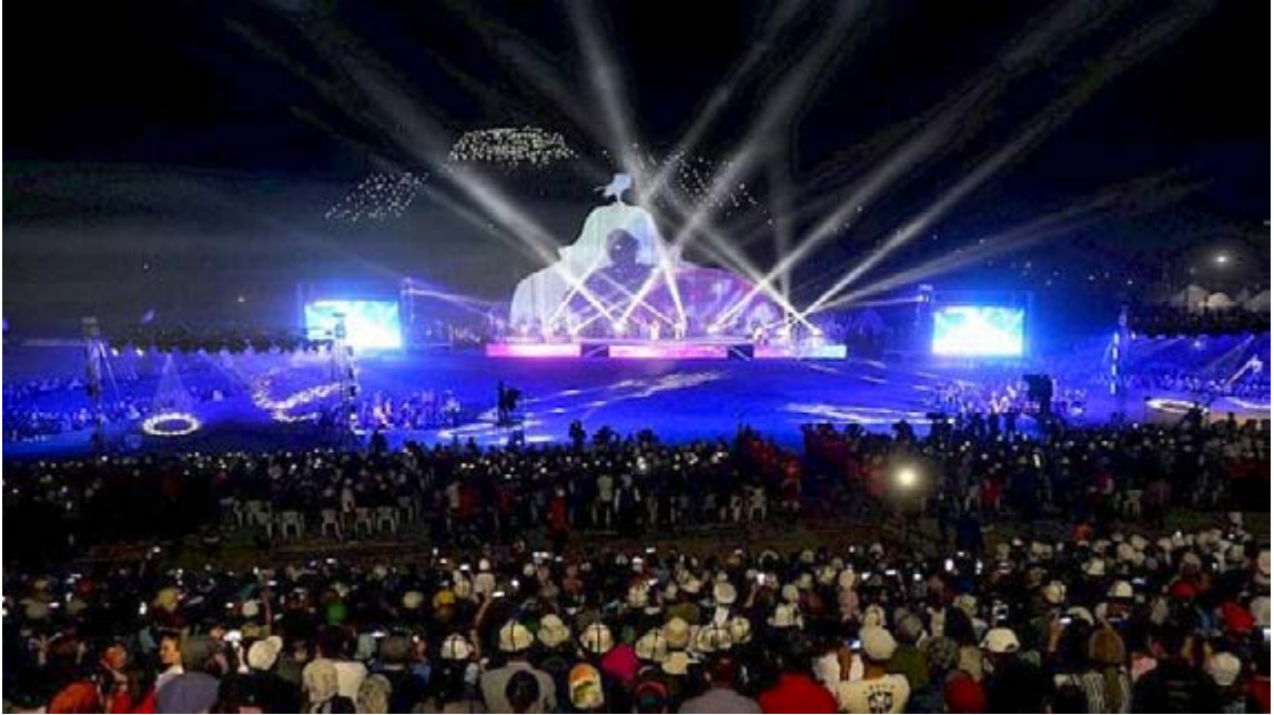
Talas'ta Gerçekleştirilen I. Ulusal Göçebe Oyunları'nın Açılışı 50

Dünya Göçebe Oyunları ile Türk dünyasının geleneksel spor ve oyunlarını uluslararası arenaya taşıyan Kırgızistan'da kamuoyunun talebi doğrultusunda 16-21 Eylül 2019 tarihinde Kırgızistan'ın Talas İl'inde bulunan Manas Ordo adlı tarihi-kültürel komplekste Birinci Ulusal Göçebe Oyunları düzenlenmiştir. 16 Eylül'de 8 değişik türde spor müsabakaları başlamış, 19 Eylül'de de kültürel etkinlikler gerçekleştirilmiştir. 2020 yılında Ulusal Göçebe Oyunları'nın yapılması için bayrak Oş bölgesine teslim edilmiştir. Ancak Covid-19 pandemisinden dolayı program gerçekleştirilememiştir.