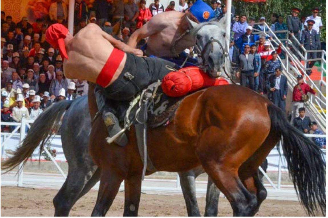
Er Eniş Müsabakası 43

Kırçın yaylasında Kırgız ayılı yani Kırgız köyü kurulmuştur. Burada Kırgızistan'ın yedi bölgesi ve Bişkek ile Oş şehirlerini de temsilen 9 alan oluşturulmuştur. Bu reyonlarda Kırgızistan 7 bölgesi ve iki büyük şehrinin kültürel değerleri yansıtılmaya çalışılmıştır. Burayı ziyaret edenler, göçebe kültürünü yakından tanıma, tecrübe etme, Kırgız gelenek ve göreneklerini, kültürünü tanıma fırsatı bulmuştur.