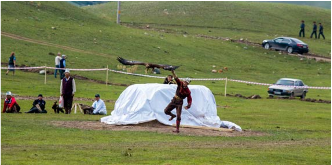
Salbuurun Gösterileri 49

III. Dünya Göçebe Oyunları'nın kapanış seremonisinde Kırgızistan Başbakanı Muhammedkalıy Abılgaziyev, Türkiye Cumhuriyeti adına programa katılan Gençlik ve Spor Bakan Yardımcısı Hamza Yerlikaya'ya 3. Dünya Göçebe Oyunları'nın bayrağını ve Han Tengri dağından getirilen, Dünya Göçebe Oyunları'nın sembolü olan su dolu Köökör'ü teslim etmiştir. Böylece IV. Dünya Göçebe Oyunları'nı düzenleme sırası Türkiye'ye geçmiş oldu.