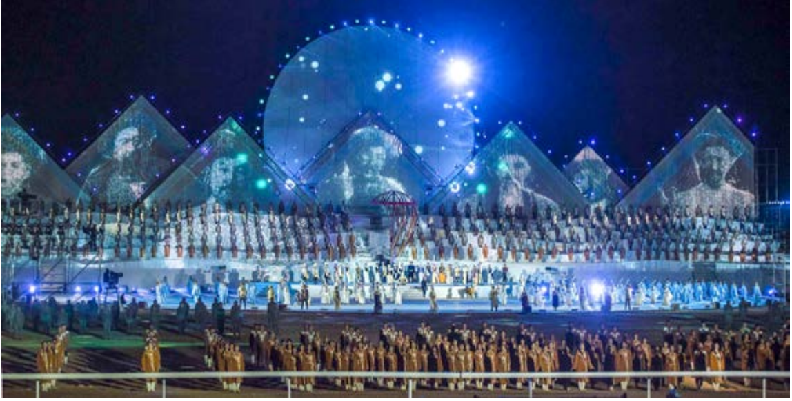
III. Dünya Göçmen Oyunları Açılış Programı 48

III. Dünya Göçebe Oyunları'nın kapanış seremonisinde Kırgızistan Başbakanı Muhammedkalıy Abılgaziyev, Türkiye Cumhuriyeti adına programa katılan Gençlik ve Spor Bakan Yardımcısı Hamza Yerlikaya'ya 3. Dünya Göçebe Oyunları'nın bayrağını ve Han Tengri dağından getirilen, Dünya Göçebe Oyunları'nın sembolü olan su dolu Köökör'ü teslim etmiştir. Böylece IV. Dünya Göçebe Oyunları'nı düzenleme sırası Türkiye'ye geçmiş oldu.