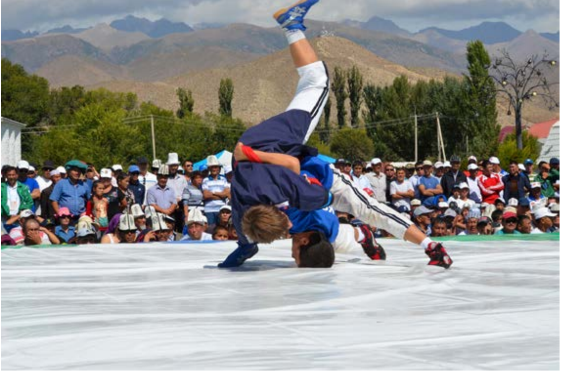
Aliş Güreşi 40

I. Dünya Göçebe Oyunları çerçevesinde aşağıdaki spor dallarında gösteri oyunları yapılmıştır: