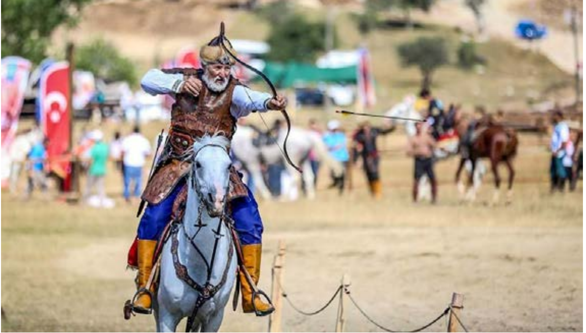
Türk Dünyası Ata Sporları Şenliği, Bursa Kocayayla 25

Türkistan coğrafyasında MÖ. 2800'lerde atın evcilleştirildiği ve demir işlemeciliğinin yaygınlaştığı görülür. Çin kaynaklarında Türklerin cins atları çok iyi bir şekilde eğittikleri, bindikleri, hayatlarını âdeta at üzerinde sürdürdükleri ifade edilmektedir. Kaşgarlı Mahmud tarafından yazılan Türk tarihinin en eski eserlerinden olan Divan-ü Lügati't-Türk'te güreş, avcılık, okçuluk, atlı sporlar, cirit, tepük, kayakçılık ve çeşitli çocuk oyunları ile ilgili önemli bilgiler bulunur. 24 Kaşgarlı Mahmud bu eserinde, At Türk'ün kanadıdır , der. Güçlü, hızlı ve cins atlar yetiştiren Türkler, bu atlarla yeryüzüne dağılmışlar, dağıldıkları bu coğrafyaları vatan yapmışlar ve yüzlerce devlet kurmuşlardır. Tarih boyunca Türklerde en çok ilgi gören sporların başında at ile yapılanlar gelir. Yine Dede Korkut Hikâyeleri'nde, Ali Şir Nevaî'de, Babürname'de, Yusuf Has Hacib'in Kutadgu Bilig'inde, Evliya Çelebi'nin Seyahatnamesi gibi Türk kültürünün en eski ve köklü eserlerinde geleneksel sporlarla ilgili önemli bilgiler bulmak mümkündür.