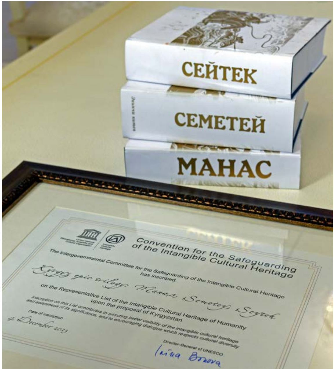
Manas Destanı 2013 Yılında UNESCO Dünya Kültür Mirası Listesine Girdi 30