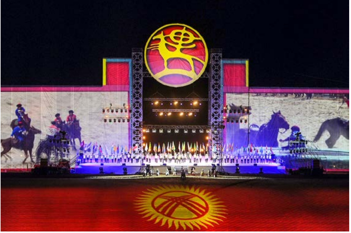
III. Dünya Göçmen Oyunları Açılış Programı 47

74 ülkenin temsilcisinin bulunduğu organizasyonda 2000 civarında sporcu etkinliklere katılmıştır. Programın gerçekleştirilmesi için Kırgızistan'daki üniversitelerden 1100 gönüllü destek vermiştir. Bu da organizasyonun en iyi şekilde gerçekleşmesi için Kırgız gençlerinin ülkeleri adına bir şeyleri yapma gayretini göstermesi adına önemlidir.