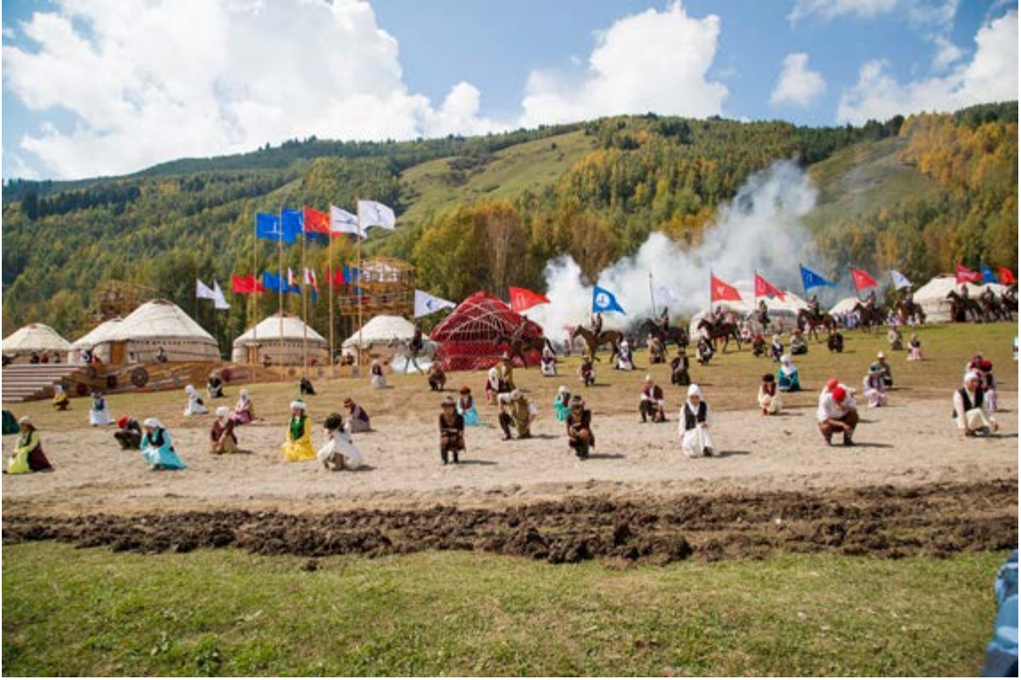
Kırçın Yaylasındaki Festival Alanı 44

Ayrıca hipodrom alanında da Nomad Fest adlı çok sayıda sanatçının katıldığı farklı etkinliklerin yer aldığı festival düzenlenmiştir. Göçebe oyunların sahne programlarına Kırgızistan'ın tüm bölgelerinden 5000 sanatçı ve oyuncu katılmıştır. Ayrıca çok sayıda yerli ve yabancı ses sanatçısı da final programında performans sergilemiştir. 45 II. Dünya Göçebe Oyunları için 30 milyon 507 bin 623 USD harcama yapılmıştır. 46