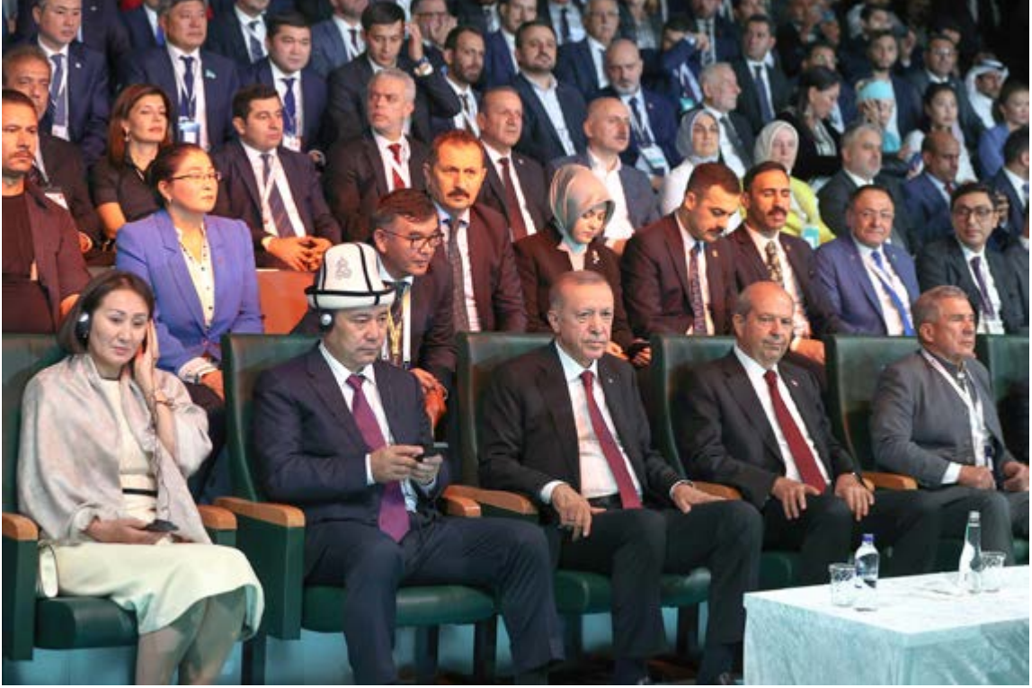
IV. Dünya Göçebe Oyunları Açılış Programı (29 Eylül 2022), İznik 55

Dünya Göçebe Oyunları'nın açılış töreni Cumhurbaşkanı Recep Tayyip Erdoğan'ın konuşması ile başlamış olup törene Cumhurbaşkanı Yardımcısı Fuat Oktay, Kırgızistan Cumhurbaşkanı Sadır Caparov, Kuzey Kıbrıs Türk Cumhuriyeti Cumhurbaşkanı Ersin Tatar, Tataristan Cumhurbaşkanı Rüstem Minnihanov, Dünya Etnospor Konfederasyonu Başkanı Necmeddin Bilal Erdoğan, Gençlik ve Spor Bakanı Mehmet Muharrem Kasapoğlu ile çok sayıda üst düzey davetli de katılmıştır.