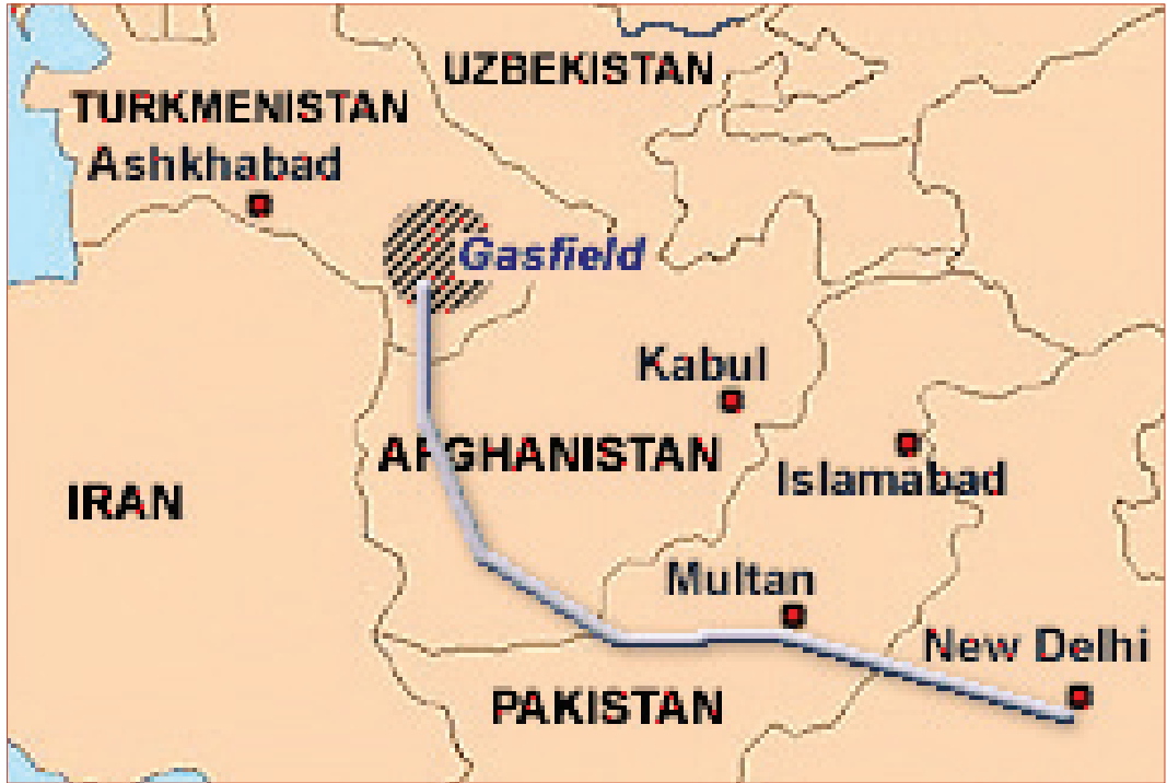
HARİTA 3: Afganistan Geçişli Doğalgaz Boru Hattı Projesi

Artan ticaret, Özbekistan'ın Hayratan'dan Mezar-ı Şerif'e bir demir yolu hattı inşasını da beraberinde getirmiştir. Yapımına 2010 Ocağında başlanan ve Kasım'da tamamlanan hattın 2011 yılı içerisinde açılması planlanmaktadır. 75 km uzunluğunda olan ve yılda 90 milyon ton yük taşıma kapasitesine sahip bu hat, Afganistan'daki en uzun demir yolu hattıdır. 38 Herat'a ulaşacak bir başka uluslararası demir yolu yapımı ise hâla devam etmektedir. Projenin finansmanını büyük ölçüde sağlayan Asya Kalkınma Bankası, projeyi Afganistan'da gerçekleştirilen en başarılı yatırım olarak tanımlamıştır. 39 Hayratan Mezar-ı Şerif hattı, Afganistan'ı Kazakistan ve Rusya ile de birleştirmektedir. Bu yolların devreye girmesiyle ticaretin daha da artacağı beklenmektedir.