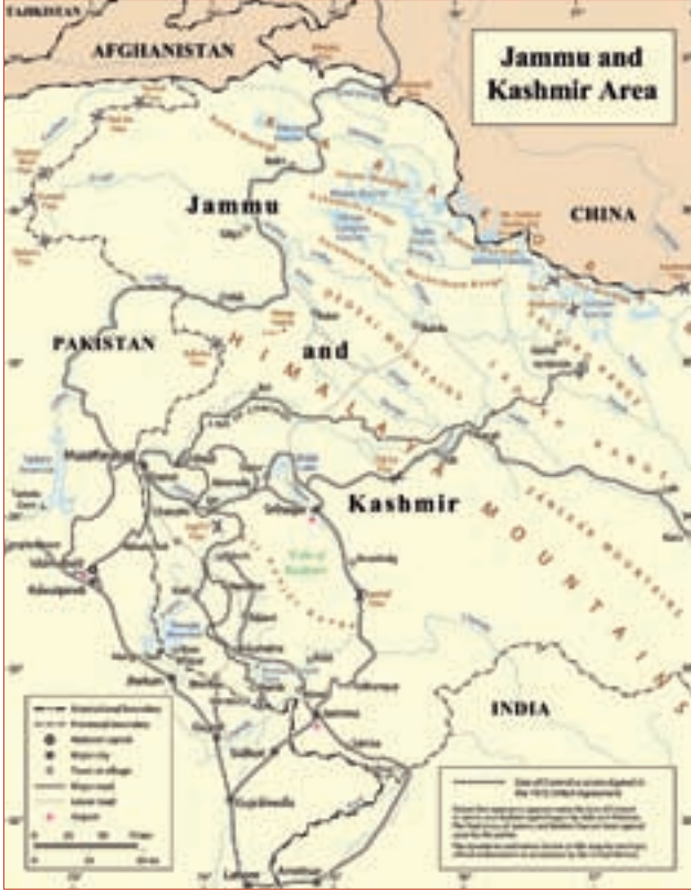
HARİTA 5: Keşmir Bölgesi Haritası

Soğuk Savaş'ın başladığı dönemde bağımsızlıklarını kazanan Hindistan ve Pakistan'ın dış politikalarını Keşmir sorunu belirlemiştir. Soğuk Savaş döneminde iki ülke birbirlerine karşı izledikleri denge politikası çerçevesinde çatışan bloklarda yer almışlardır. Hindistan, başlangıçta tarafsız kalmaya çalışmıştır. Ancak Pakistan'ın 1954 yılında NATO'nun bir uzantısı şeklinde ortaya çıkan Güney Doğu Asya Anlaşması Örgütü'ne (SEATO) üye olarak Batı bloğuna dahil olması, Hindistan'ı Sovyetler Birliği'ne kaydırmıştır. Hindistan, 1955 yılındaki Bandung Konferansı ile başlatılan Bağlantısızlık Hareketine destek vererek Üçüncü Dünya'nın liderliğine