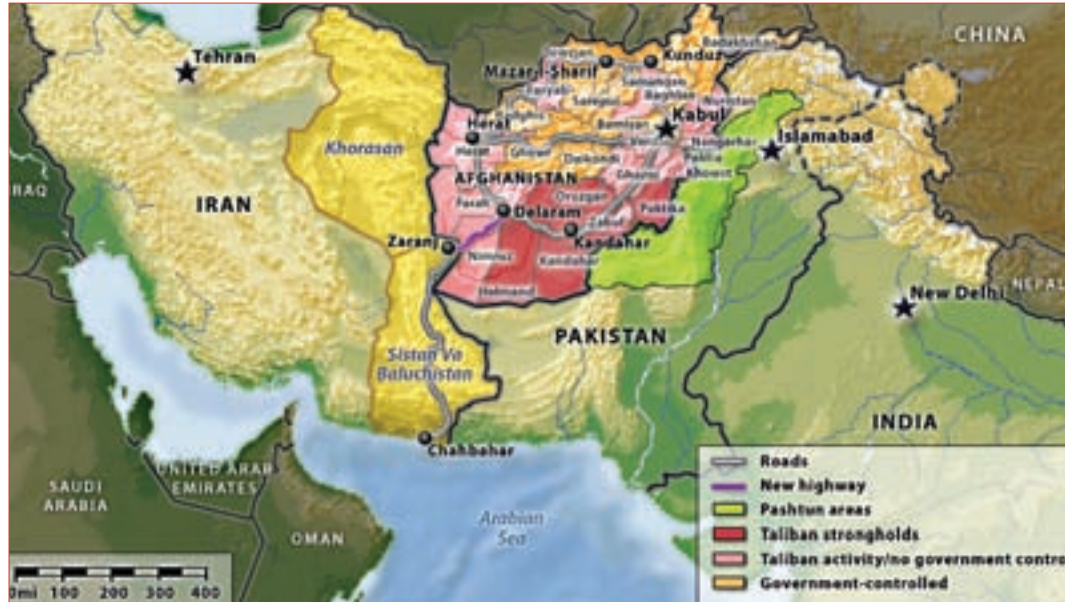
HARİTA 2: Afganistanı Ticaret Köprüsü Yapan Ulaşım Projeleri

ABD'li uzmanlar Starr ve Kuchins, ortaklaşa olarak hazırladıkları "The Key to Success in Afghanistan: A Modern Silk Road Strategy" başlıklı raporda, 18-24 ayda tamamlanabilecek bir kalkınma programı önerilmektedir. "Gerekli öncelik ve ortak yönetim sağlanırsa 18-24 ayda tamamlanabilecek bu proje ile Afgan halkının yaşam seviyesi yükselir, Afgan ordusu güçlenir ve hükümete destek artar. Afgan Çevre Yolu ile Kabil-Herat otobanının tamamlanması, bunların kıta karayolları ile özellikle de Pakistan'ın Gwadar limanına bağlantıları sağlanmalıdır. TAPI boru hattının inşası, Orta Asya, Afganistan, kuzey Pakistan ve Hindistan'ın elektrik ağı ile döşenmesi gibi adımlar, özel sektörün ve yatırımcıların da ortaya çıkmasını sağlayacaktır. El Kaide'yi ortadan kaldırmaya ve Taliban'ın etkisini azaltmaya yönelik ABD'nin Afganistan stratejisi, Afgan halkına ve Afganistan'ın komşularına herhangi bir katkıda bulunmamaktadır. Çok maliyetli bu askerî projeler, ekonomiyi güçlendirecek basit ulaştırma yatırımlarıyla desteklenmelidir." 30