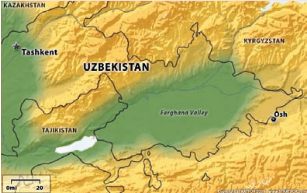
HARİTA 7: Fergana vadisi

Bakiyev'in devrilmesinin ardından Roza Otunbayeva başkanlığında kurulan yeni yönetim, yasallık kazanabilmek için yeni bir anayasa hazırlığına girişmiştir. 27 Haziran 2010'da gerçekleştirilen referandum sonucu yeni anayasa kabul edilmiştir. Kırgızistan'da yönetim sistemini değiştirerek parlamenter sistemi getiren yeni anayasa uyarınca ülkede 10 Ekim 2010 tarihinde milletvekili seçimleri yapılmıştır. Seçimlerin ardından Kırgızistan Sosyal Demokrat Partisi (SDPK), Respublika (Cumhuriyet) ve Ata-Jurt Partisi'nin oluşturduğu koalisyon hükümeti, Aralık 2010'da parlamentodan güvenoyu almıştır. Kırgızistan Sosyal Demokrat Partisi lideri Almazbek Atambayev ise, başbakan seçilmiştir. Orta Asya'nın tek parlamenter demokrasi ile yönetilen ülkesi olan Kırgızistan, Ekim 2011'de cumhurbaşkanlığı seçimlerine hazırlanmaktadır. Cumhurbaşkanının halk tarafından seçilecek olması, ülkenin siyasal sistemine ilişkin tartışmaların devam edeceği ihtimalini doğurmaktadır.