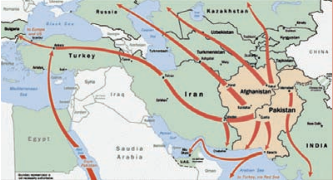
HARİTA 6: Uyuşturucu Taşıma Yolları

Orta Asya ve tüm dünya açısında Afganistan’ın doğurduğu en önemli güvenlik sorunu, uyuşturucu üretimidir. Afganistan’a komşu olan Orta Asya cumhuriyetleri, hem transit ülke olmaları, hem de tüketici olmaları açısından zarar görmektedirler. BM