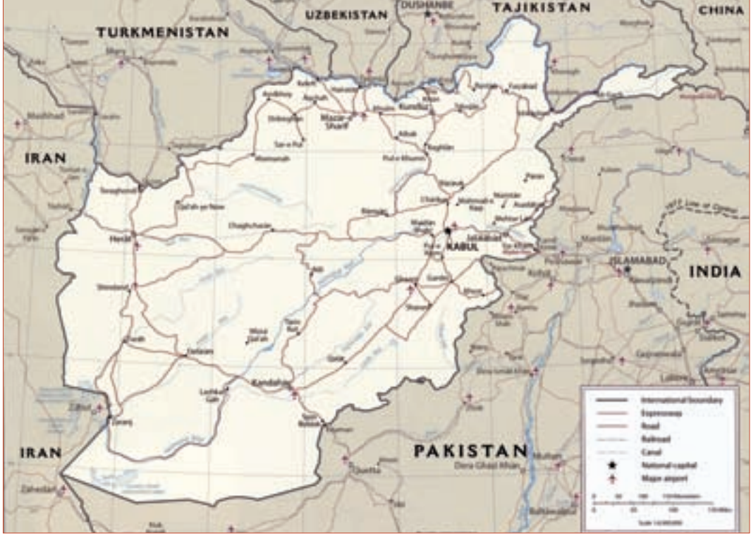
HARİTA 1: Afganistan Siyasî Haritası

Orta Asya cumhuriyetlerinden üçü (Özbekistan, Türkmenistan ve Tacikistan) ve İran, Pakistan, Çin ile sınırdış olan Afganistan, Orta Asya ile Güney Asya'yı, Batı Çin ile Doğu İran'ı birbirine bağlayan geçiş noktasında bulunmaktadır. Orta Asya'dan, Güney Asya'ya giden ve gitmesi planlanan bütün yolların Afganistan'dan geçmesi gerekmektedir. Bu coğrafi gerçeklikten hareketle Taliban sonrası Afganistan yönetimi ve bu yönetimi güçlendirerek tek başına ayakta durabilecek güvenilir bir müttefik hâline getirmek isteyen ABD, Afganistan'a komşu olan Orta Asya cumhuriyetleri, İran, Çin ve Pakistan gibi ülkeler, Afganistan'ı bölgesel ticaretin merkezî yapma yönünde politikalar başlatmışlardır. Özellikle 2006 yılından itibaren, Afganistan'da ve Afganistan'a komşu ülkelerde ulaşım alt yapısının tesisine ilişkin pek çok farklı proje gündeme gelmiş, adeta bir proje rekabeti başlamıştır. ABD'nin yürürlüğe koyduğu Büyük Orta Asya girişimi, Afganistan ve komşularındaki bu hareketlilikte önemli rol oynamıştır. Bu süreç, Avrasya kıtasına güvenlik ve refah getirecek Modern İpek Yolu'nda eksik halkanın bina edilmesi olarak tanımlanmaktadır. 2