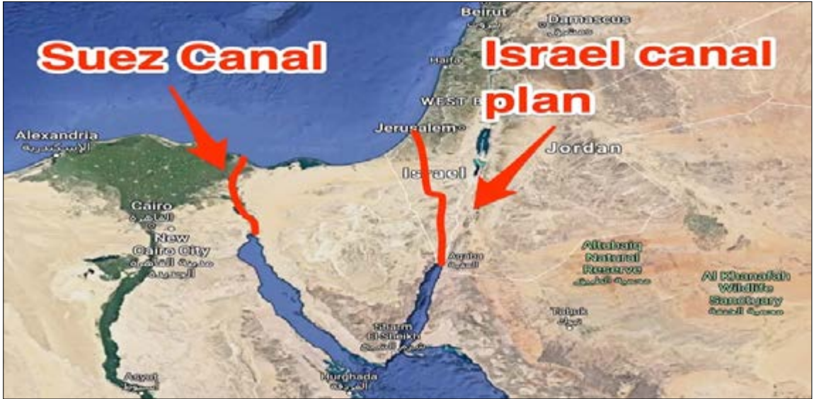
Süveyş Kanalı Alternatif Arayışları

pa'nın en büyük ve en işlek trafiğe sahip Rotterdam Limanı'ndan Japonya'ya uzanan deniz yolculuğunun süresinin 30 günden 18 güne düşmesi öngörülüyor. Bir başka ifadeyle doğu ile batı arasındaki deniz yolu mesafesi yaklaşık 4.600 deniz mili azalacaktır. Mesela Japonya'dan demir alan bir gemi Hamburg Limanı'na Süveyş Kanalı'nı kullanarak yaklaşık 50 günde ulaşabiliyorken Kuzey Deniz Yolu'nun hayata girmesiyle bu sürenin 35 güne ineceği tahmin edilmektedir. Son tahlilde Rusya Kuzey Kutbu vasıtasıyla Avrupa'dan Asya'ya bir deniz yolu kurmak ve bütün yıl bu yolu kullanılabilir kılmak için ciddi bir planlama yürütmektedir.